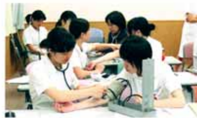
看護技術「バイタルサイン測定」