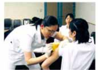
看護技術「筋肉内注射」