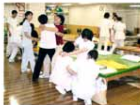
看護技術「移乗・移動」