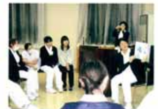
プリセプティフォローアップ研修

桜の花びらが舞う春に、初々しく看護師としてスタートした新人さんも、 一年の研修で様々な事を学び一回りも二回りもたくましくなって、羽ばたいていきます。